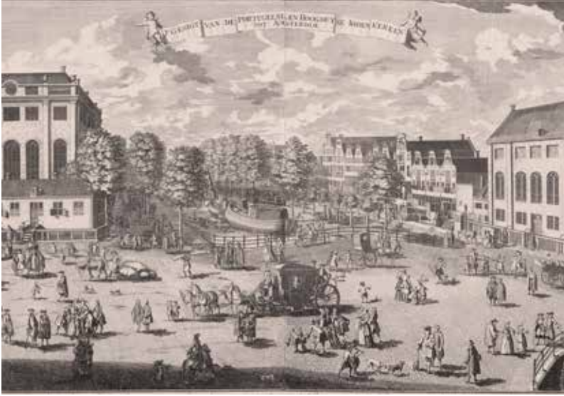
Prent door Abraham Rademaker. Datering 1730 t/m 1735. Beeldbank Amsterdam.