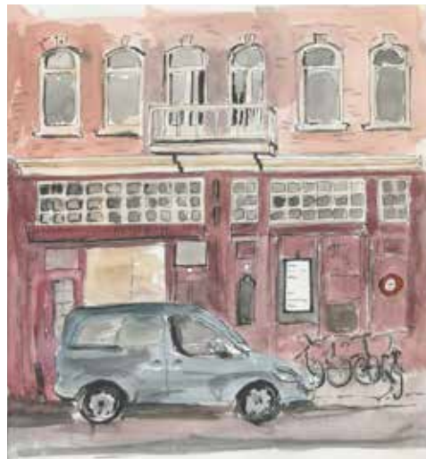
2 november 2018, Bakker Rooth

Echte Amsterdamse straatpoëzie. En in al zijn melancholie een mooi contrast met 'Let's rule the World' van de nieuwe Plantagegebruikers, de studenten.