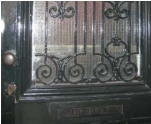
de originele deur

Hoezeer het overleven van de oorlog afhing van toeval en geluk wordt op dat moment haast tastbaar.