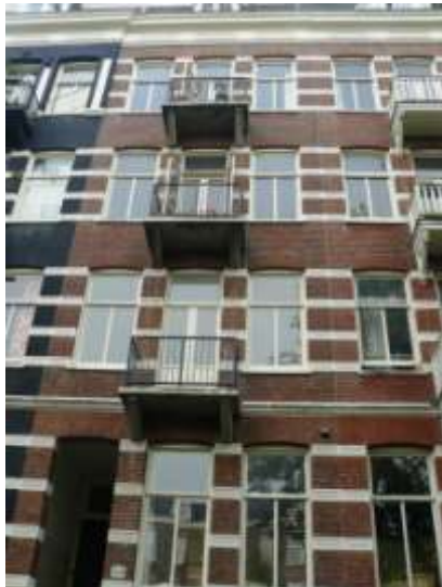
Nieuwe Prinsengracht 106

'Op Goede Vrijdag, twintig jaar geleden, wordt er aangebeld. Met mijn dochter van twee jaar op de arm loop ik naar de deur en er staat een man van een jaar of 70 op de stoep. Kennelijk voel ik direct iets aan, mijn benen beginnen te trillen. "Hier heb ik gewoond als kind", zegt hij. "Meneer, het huis is van u", is mijn ietwat overdreven reactie. Hij loopt meteen door naar de voorkamer, waar nu de keuken is, en herinnert zich hoe hij een zwarte vogel uit het water van de gracht zag opvliegen toen hij ziek op bed lag. Dat beeld blijft me bij. Dat man vertelt dat hij naar Canada is geëmigreerd, zijn ouders en zus hebben de oorlog niet overleefd. Bij het weggaan zegt hij dat de deurknop nog dezelfde is. Hij is maar tien minuten binnen geweest, ik heb niet naar zijn naam gevraagd, het was de eerste keer.'