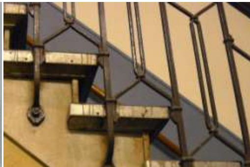
Centrale hal PIZ

In het ziekenhuis dat tot stand kwam met steun van de gemeente Amsterdam was ook plaats voor particuliere patiënten van alle gezindten.