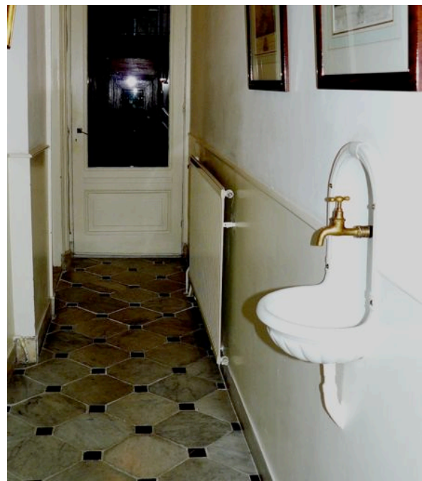
Sarphatistraat 115, het fonteintje