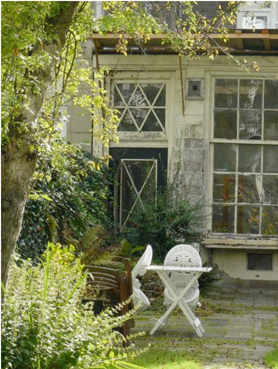
Tuinhuis achter Nieuwe Keizersgracht 20

De woonkamer gaat aan de achterkant over in een lange woonkeuken, daarachter is de serre, aangebouwd in 1927, en via een buitentrapp kom je in de tuin. Nog is de rondleiding niet klaar. Achterin de tuin staat het tuinhuis. In al zijn vergane glorie staat het te pronken in de zon.