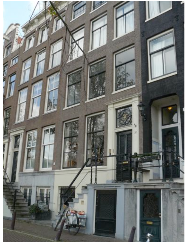
Nieuwe Keizersgracht 20